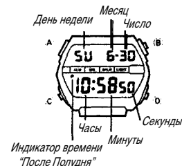
Индикатор времени "После Полудня"