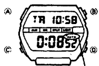
Индикатор подключения функции автоматического повтора